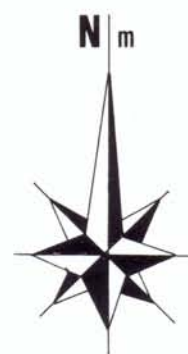
PLAN DU FOND (2)