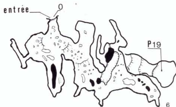
PLAN D'ENTRÉE (1)