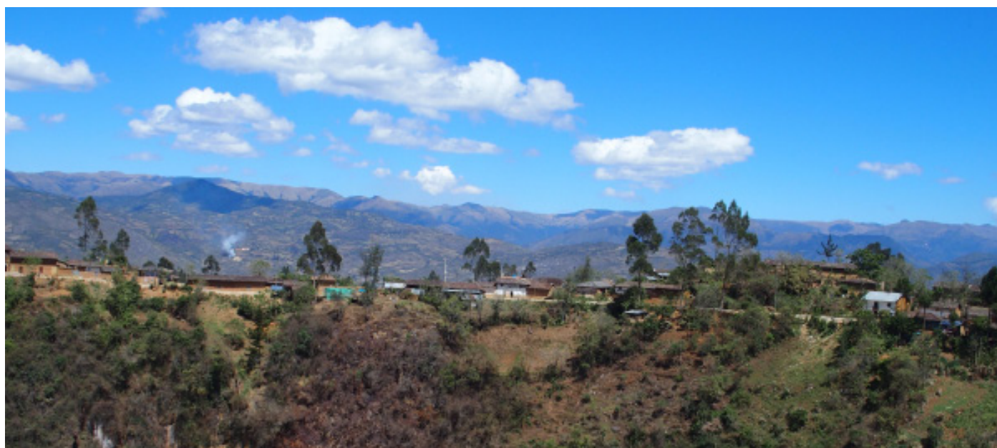
Village de La Jalca (CP, 26/08/2016)