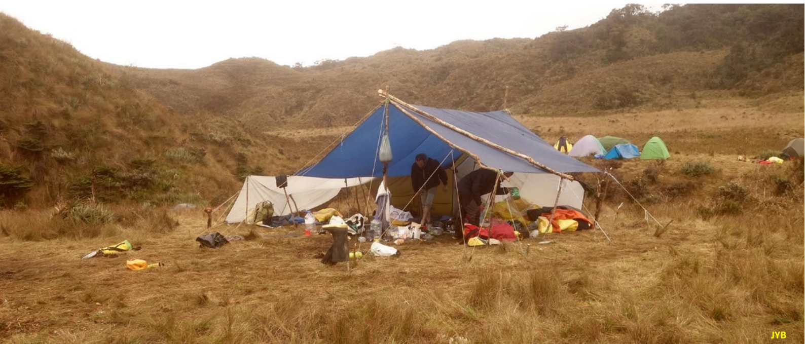
Figure 8. L'abri-cuisine du camp de Lorenzo