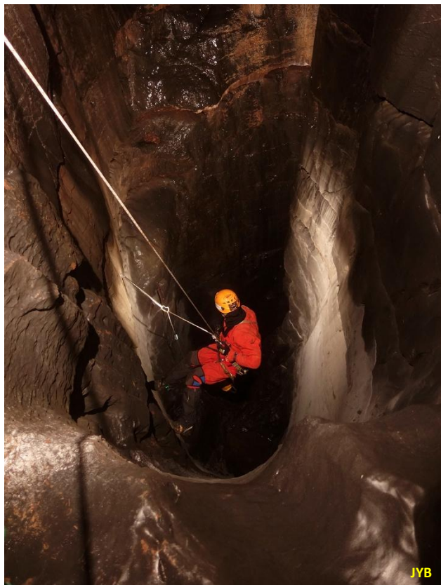
Figure 4. Puits luisants et lisses de « Eagle Nest »