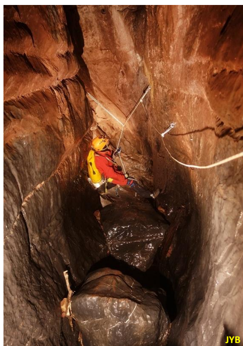
Figure 3. Équipement dans les puits « Eagle Nest » du Tragadero dit « Big One »