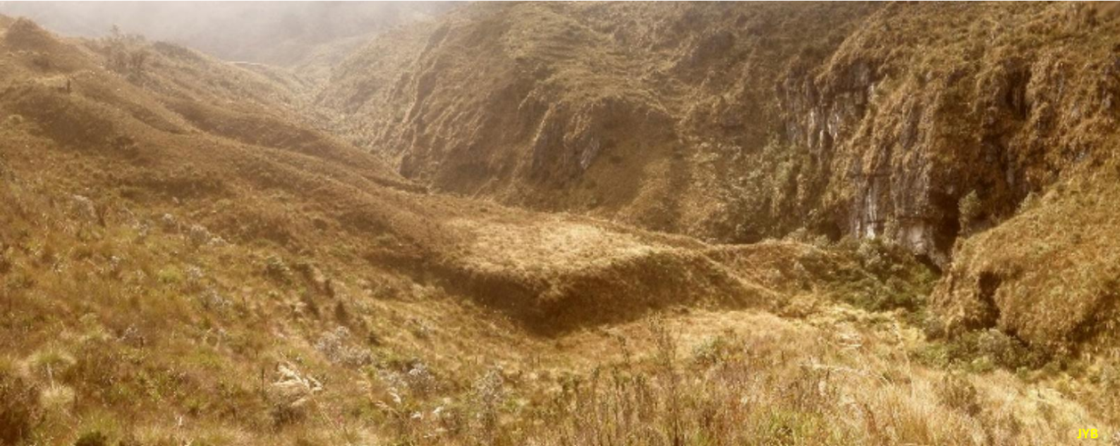
Figure 7. Doline du Tragadero de Lorenzo dit « Big One »