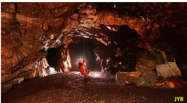
Figure 6. Remontée depuis la « Majasive Chamber ». La cascade n'est encore qu'un filet d'eau insignifiant