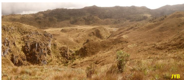
Figure 2. Au premier plan, la doline dite « Small One » et, dans la plaine (ancien poljé de contact), on aperçoit les tentes du camp de Lorenzo dit « Scottish Loch Camp ». Les bassins d'alimentation des Tragaderos de Lorenzo (« Big » et « Small ») sont très vastes et s'étendent jusqu'aux pentes du Pico del Oro situées en arrière-plan