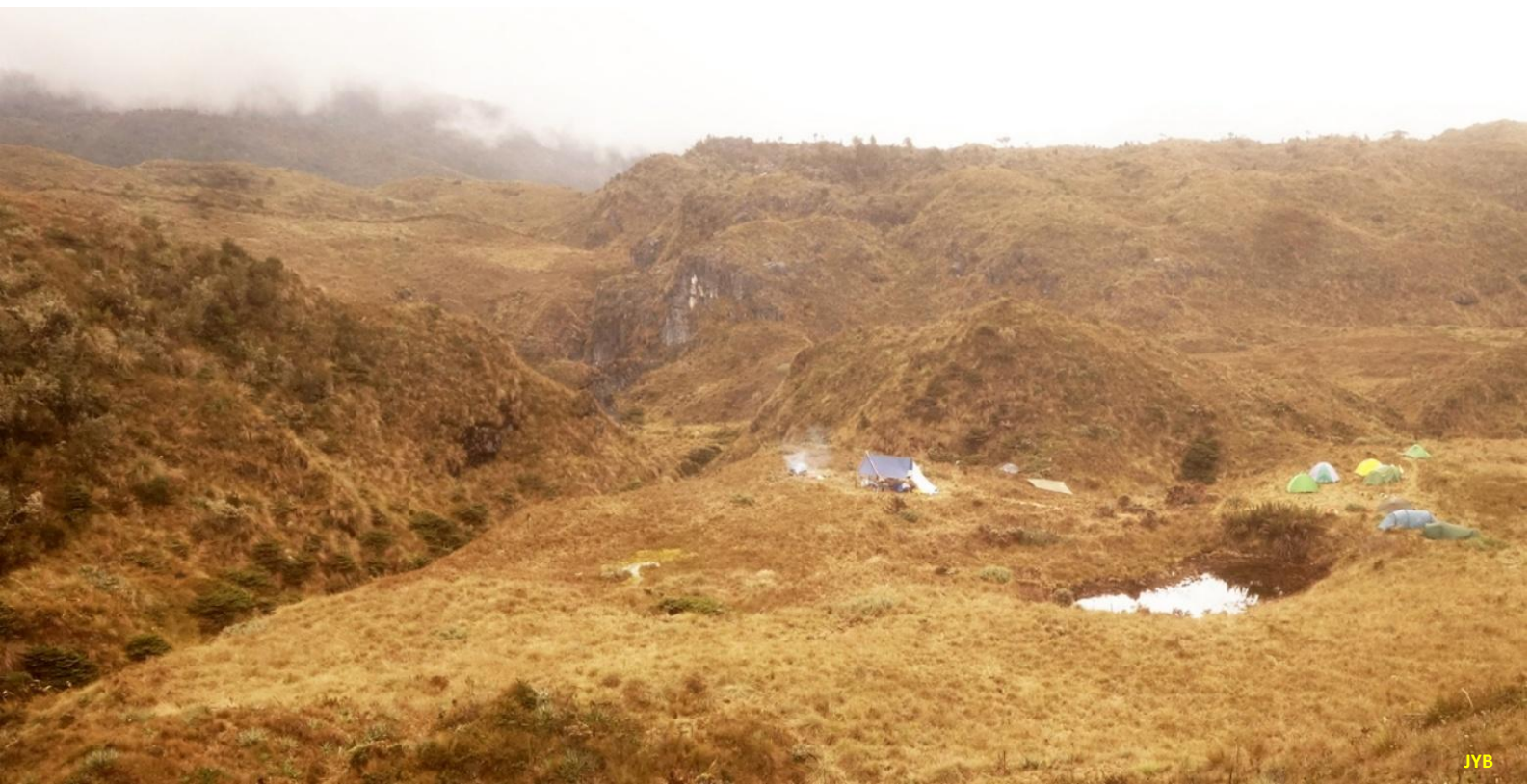
Figure 9. À gauche, le vallon qui alimente le Tragadero dit « Small One » (au fond), et à droite, le camp de Lorenzo ou « Scottish Loch Cam