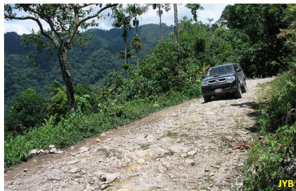
Figure 2. Retour sur la piste après constatation que la quantité de carburant dont nous disposions ne permettait pas d'atteindre l'objectif de Vista Alegre

grotte de Samuel sera un bel objectif pour l'expédition 2014.