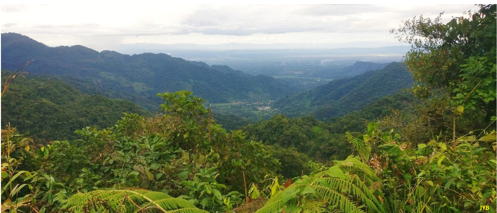
Figure 4. Le village de Naciente del Rio Negro vu depuis le col de Consuelo